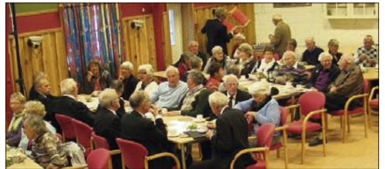
FULLT HUS: Lokalets godt over 100 plasser var fullt besatt i god tid før forestillingen.

GRAN: Bjørnsonåret, 100 år etter dikterhøvdningen Bjørnstjerne Bjørnsons død, blir markert mange steder og på mange måter.